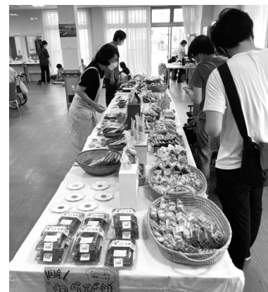
お買い物中の様子

新型コロナウイルス感染症の予防対策も徹底していますので、出張マーケットのご要望がございましたら授産活動支援センターまでお問い合わせください。